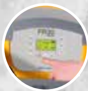
Fonction mode silencieux