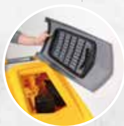
Débris tray + filtre