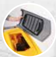
Debris tray + filtre