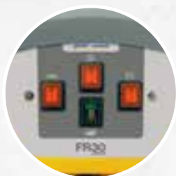
Panneau de commandes