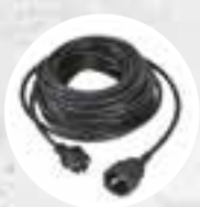
Câble 15 m