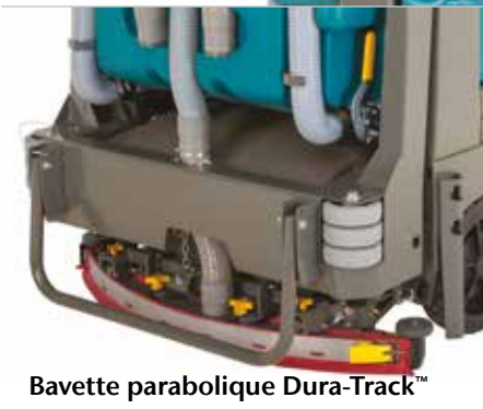
Bavette parabolique Dura-Track™