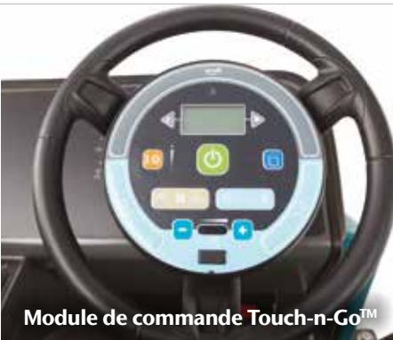
Module de commande Touch-n-Go™