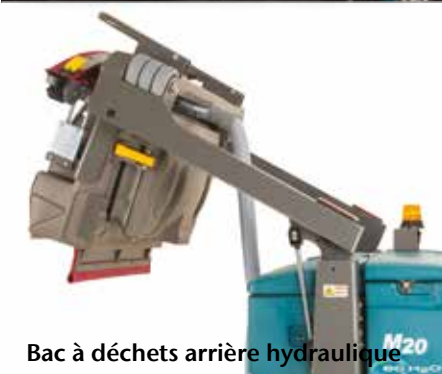
Bac à déchets arrière hydraulique