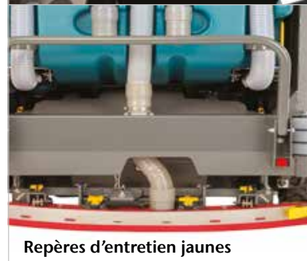
Repères d'entretien jaunes