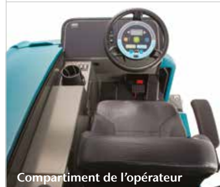
Compartiment de l'opérateur